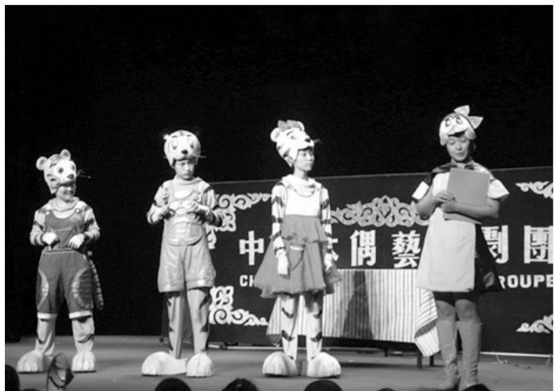
北京朝阳区垡头地区文化中心为五乡一街少年儿童举办暑期公益演出

如果说公共图书馆的总分馆制建设是将县域内的公共阅读资源进行充分整合,使人、书、资源顺畅地流动起来,那么文化馆总分馆制建设则是更加灵活地将县域群众文化艺术资源进行统筹调配,充分发挥基层专职文化工作者的力量。