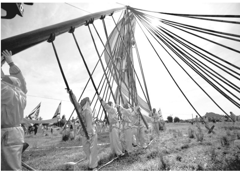
6月13日，“非遗薪传”——浙江传统体育展演展评系列活动综艺展演中的浙江省级非遗磐安“迎大旗”展示现场。

浙江传统体育项目地域特色浓郁、风格独特，拥有传统体育类国家级非遗项目8个、省级非遗项目60个。据浙江省非遗保护中心主任郭艺介绍，2011年以来，浙江开展了“非遗薪传”展评系列活动，本次系列活动是历届“非遗薪传”系列活动中参与项目、人数最多的一次；展评项目具有鲜明的地域特色，内涵丰富，充分体现了浙江传统体育类非遗项目的多样性和丰富性，特别是发